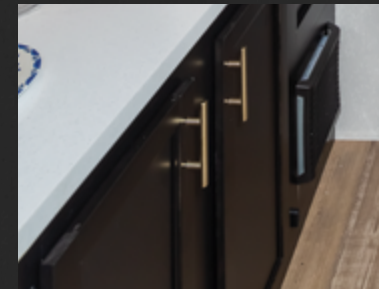
Portes d'armoires en bois franc