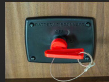
Disjoncteur de batterie