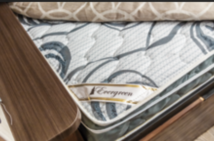
Matelas à plateau-coussin