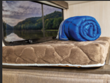
Coussins pour lits superposés surdimensionnés