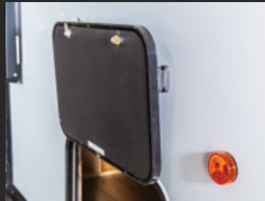
Loquet de porte à bagages mains libres