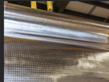
Isolation thermique Arctic