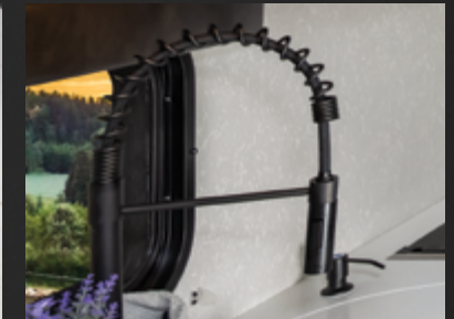
Robinet escamotable de style résidentiel