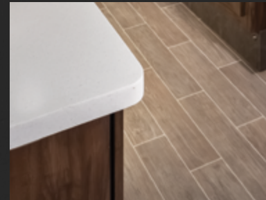
Comptoir à surface solide LG