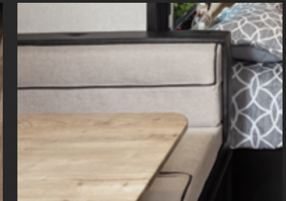
Tissus de designer

Extérieur de la Wolf Pup édition Black Label Fibre de verre gélatineux Timon électrique Jantes en aluminium