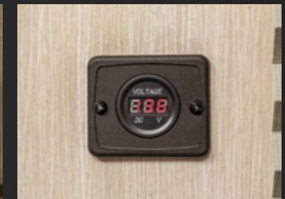
Moniteur de charge pour la batterie