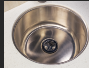
Lavabo profond en acier inoxydable